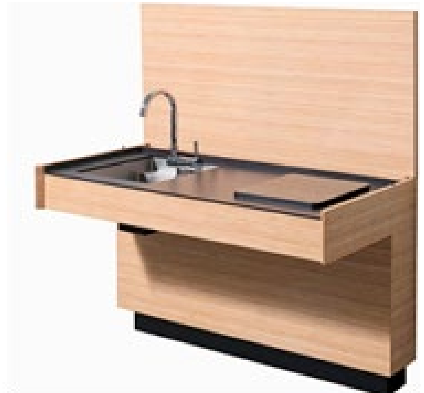
ПРОЕКТ ДИЗАЙНЕРА ЮТО РИЗ (YUTO RIE) ДЛЯ SANWA КУХНЯ АС 01

Это дизайн для небольших пространств. Производители соревнуются в микромасштабных достижениях: маленькие столики, компактные диваны, мини-лампочки, складные стулья. Стендисты объясняют это тем, что девелоперы по всему миру сокращают средние площади квартир. Умы дизайнеров занимает все, что поможет современному человеку уместиться на небольших количествах метров, при этом не потеряв в комфорте.