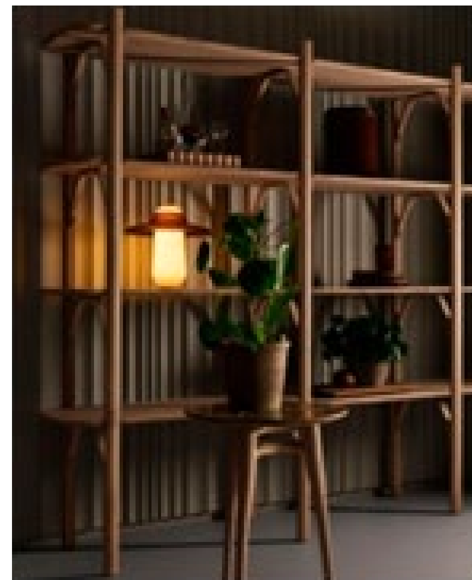
ПРОЕКТ КАСПЕРА ВИССЕПСА REVISED

Мода на послевоенный дизайн в тренде, развивается стремительно вместе с общим развитием дизайна как части культурного потребления. Музеи покупают дизайн, мебельщики это отлично понимают.