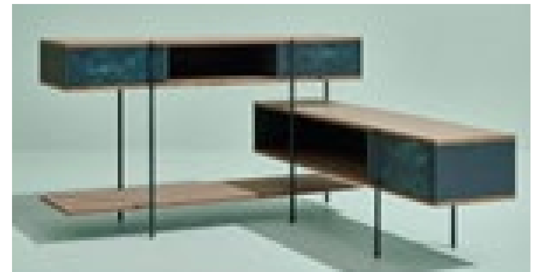
КОЛЛЕКЦИЯ PIVOT, ДИЗАЙН ДЖАКОМО МУР. SEM.

Молодые покупатели хотят современные формы в своих домах, но готовы покупать вещи, которые имеют «деревенский» вид. Декораторы вспомнили японский принцип wabi-sabi, акцент на использовании предметов, сделанных с врожденными несовершенствами и подчеркнутым ощущением подлинности. Натуральное дерево обязательно соседствует с чем-то блестящим и гладким. Например, в коллекциях Voffi грубые деревянные полки сосуществуют рядом с тонким металлическим каркасом, чашами из современных композитов и большими зеркалами. Старое дерево плюс металл — безусловный must многих коллекций.