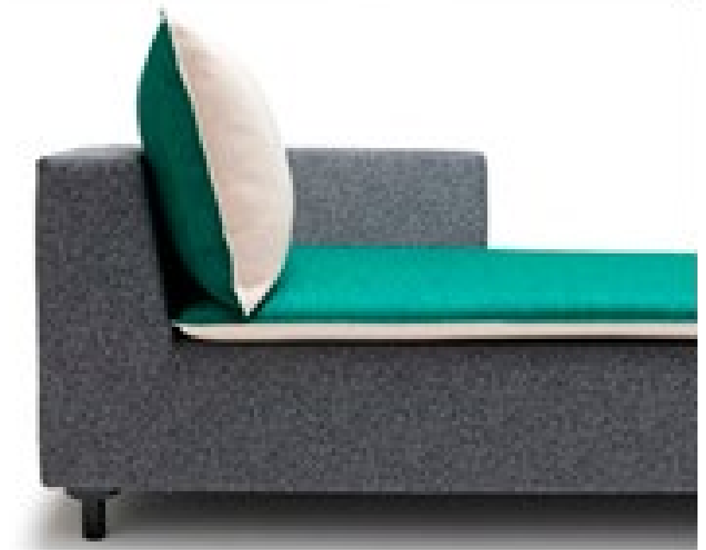
ДИВАН BARBICAN, ДИЗАЙН КОНСТАНТИН ГРЧИЧ, ESTABLISHED&SONS