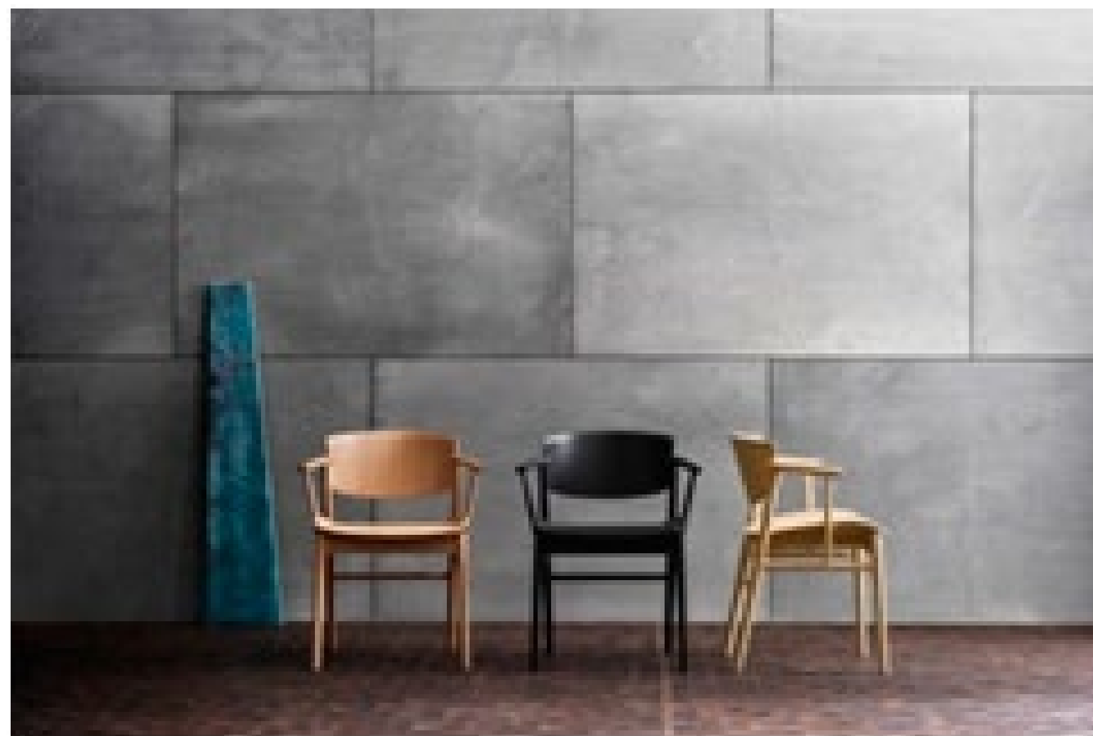
СОВМЕСТНЫЙ ПРОЕКТ NENDO ДЛЯ FITZHANSEN, ПРЕЗЕНТОВАН НА ISALONE: СТУЛ №01

Прослеживается на стендах, отмечается интерес к простым, прочным и элегантным вещам, светлому дереву, мягкому рассеянному свету. Здесь уместны винтажные предметы, потому что скандинавы всегда учат ценить личные воспоминания.